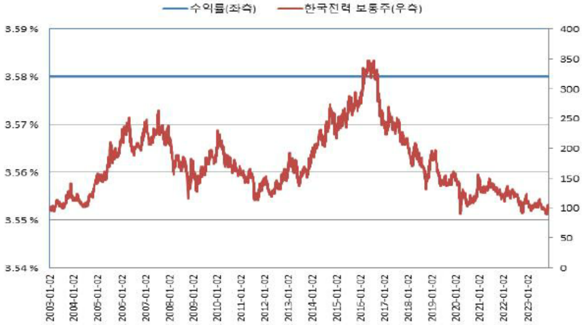
교보증권 제50067회 주가연계파생결합사채 (수익률 모의실험)