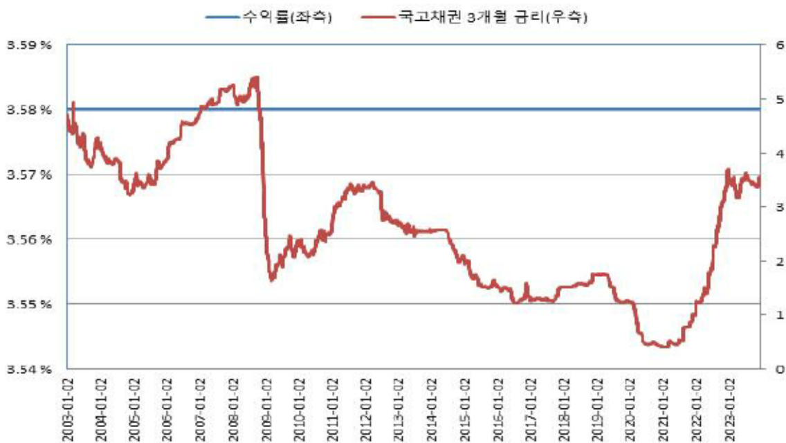
교보증권 제1179회 기타파생결합사채 (수익률 모의실험)