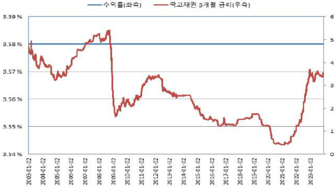
교보증권 제1179회 기타파생결합사채 (수익률 모의실험)